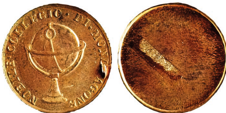
Fig. 12 – Medaglia o distintivo del Nobile Collegio Mondragone (fine XIX- inizi XX sec.). Su concessione del Ministero della Cultura – Museo Nazionale Romano.

Per terminare questa rassegna, si segnala che presso il medagliere del Museo Nazionale Romano è conservata una placchetta circolare uniface coniato in bronzo (26 mm) 80 . La medaglia raffigura nel campo un mappamondo circondato dalla legenda NOBILE – COLLEGIO – DI – MONDRAGONE (fig. 12), un'iconografia riproposta spesso nelle emissioni legate ad accademie e convitti 81 . La medaglia, proveniente dalla raccolta dei fratelli Padoa, è stata acquisita dal museo nel 1910 e risale quindi alla fine dell'Ottocento o ai primissimi anni del secolo successivo. In base alla sua morfologia, poteva essere pertinente a una spilla o a un distintivo, manufatti spesso citati in relazione alla vita scolastica di Mondragone 82 .