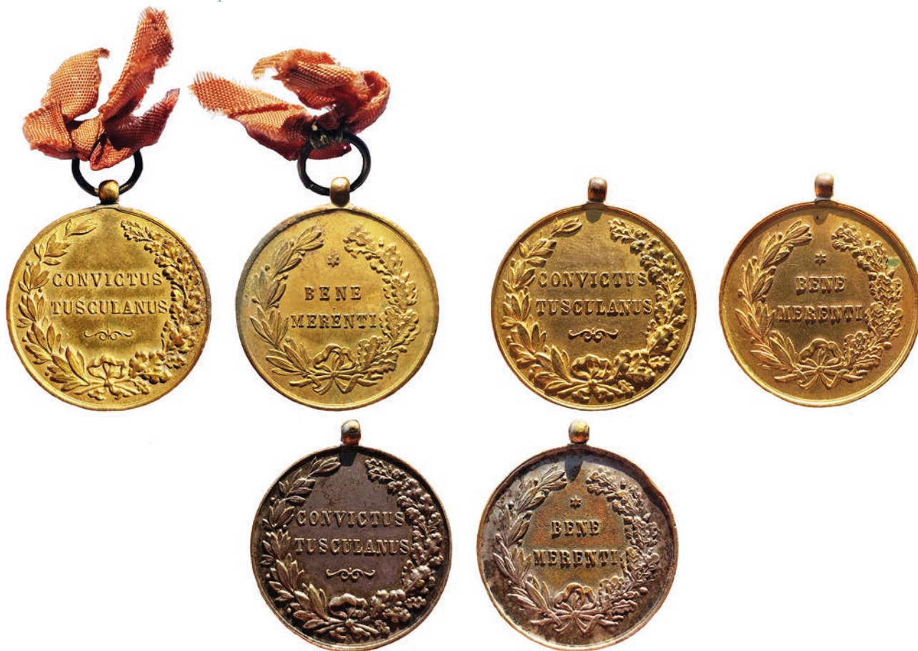
Fig. 7 – Medaglie premio del Nobile Collegio Mondragone di tipo 2a.

di una medaglia di benemerenzia emessa da Leone XIII 59 . La medaglia, realizzata da un'officina privata a partire dal 1878, raffigura al dritto il busto del pontefice e la legenda LEO – XIII – PONTIFEX – MAXIMVS con un fregio, e al rovescio la medesima raffigurazione dei due esemplari mondragoniani (fig. 6: 1). Il conio utilizzato per il rovescio delle medaglie di Leone XIII mostra una coincidenza o una strettissima parentela con quello impiegato per gli esemplari del convitto, denotando la provenienza da una stessa officina romana 60 : l'impronta è pressoché identica e i tipi sono caratterizzati persino dal medesimo difetto di conio, ovvero una piccola escrescenza curvilinea di metallo rilevabile alle ore 1 del giro tra la cornice e la ghirlanda 61 . Nel corso del papato di Leone XIII, lo stesso modello di rovescio fu impiegato anche per un'altrettanto rara emissione di medaglie di benemerenzia fatta coniare dal vicino comune di Frascati (fig. 3: 4) 62 , e per alcune medaglie premio dell'Istituto Angelo Mai di Roma, conosciute solo attraverso sporadiche apparizioni sul mercato numismatico.