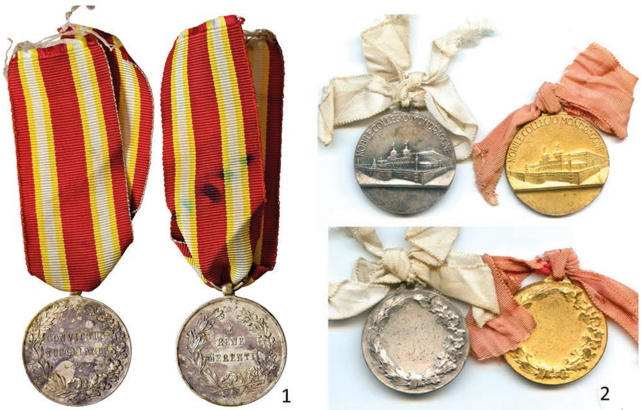
Fig. 11 – Medaglie premio del Nobile Collegio Mondragone di tipo 2a (1) e 3 (2) con nastri e fiocchetti.