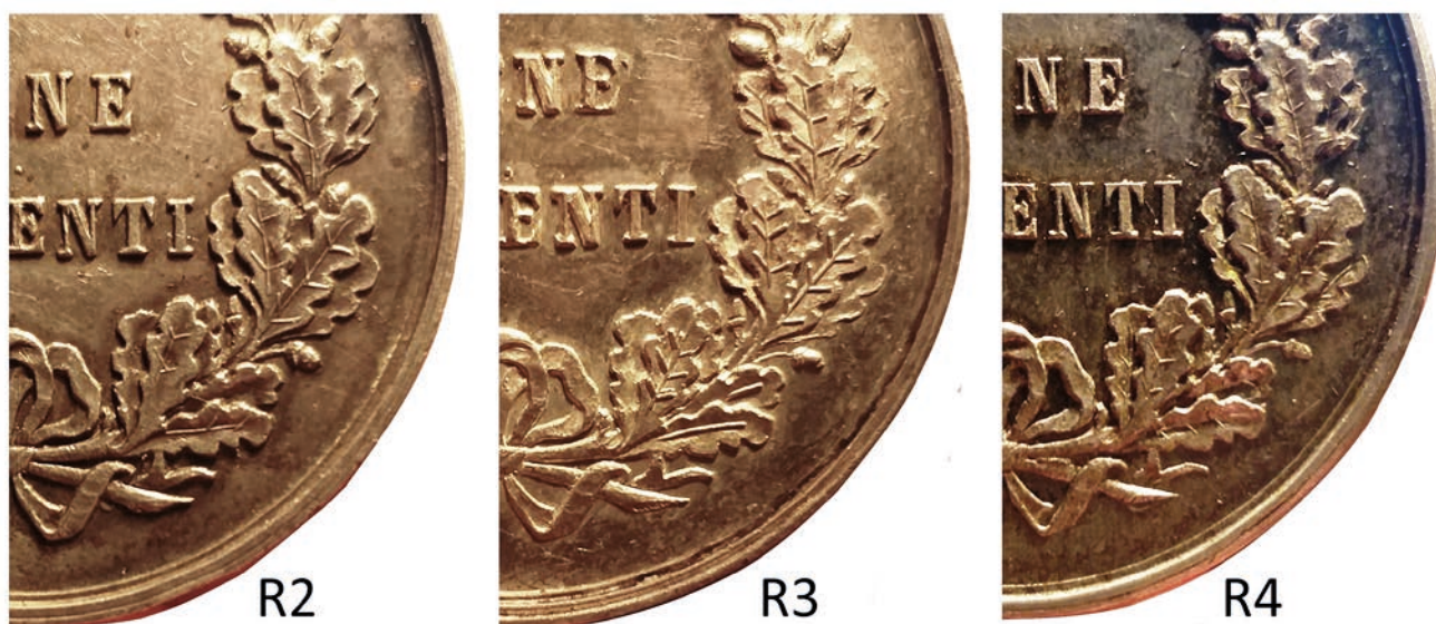
Fig. 9 – Ingrandimento del rovescio delle medaglie di tipo 2 con le varianti di conio R2, R3 e R4.

rianti 68 , e poi ripresa nelle medaglie di benemerenzia emesse dai suoi successori Benedetto XV e Pio XI 69 . A partire dal 1903, queste medaglie furono tutte realizzate presso il rinomato stabilimento Stefano Johnson di Milano 70 . Con Pio XII (1939-1958) furono realizzate altre tre tipologie di medaglie di benemerenzia, tra le quali una della ditta Johnson simile alle precedenti ma di grande modulo (39 mm) 71 .