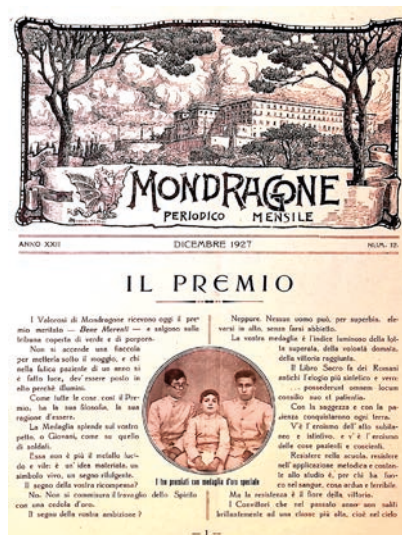
Fig. 2 – Frontespizio di un numero del giornale scolastico "Il Mondragone" risalente al 1927.

La vita nel collegio era organizzata rigidamente e improntata ad una educazione di alto livello. Tra i docenti più insigni del collegio – per fare un nome – si ricorda l'illustre grecista Lorenzo Rocci, l'autore del più famoso vocabolario greco-italiano, che a partire dal 1899 ebbe a più riprese la cattedra di lettere latine e greche e che a Mondragone coprì incarichi direttivi fino agli anni Quaranta del Novecento 12 . Nel collegio erano impartite lezioni di materie letterarie e scientifiche, associate ad insegnamenti religiosi e ad attività sportive o extracurricolari (come lingue, recitazione, musica e disegno). Il complesso era dotato di dormitori, refettorio, infermeria, gabinetti scientifici, aree di gioco e, dai primi decenni del Novecento, anche di una sala cinematografica. Ai genitori veniva inviato su base settimanale un resoconto con il profitto scolastico dei figli 13 . A partire dal 1866, sotto la guida dei precettori, gli studenti iniziarono inoltre a produrre anche alcuni periodici scolastici. Tra questi, "Il Mondragone" fu quello più longevo e di maggiore successo. Nato come giornalino manoscritto nel luglio 1866, dal 1905 fu pubblicato con cadenza bimensile o mensile e acquisì una veste editoriale e tipografica di livello professionale (fig. 2). Il giornale era distribuito anche in abbonamento e sopravvisse fino ai primi anni '50 con gli ultimi numeri in carta patinata, fornendo una eccellente fonte