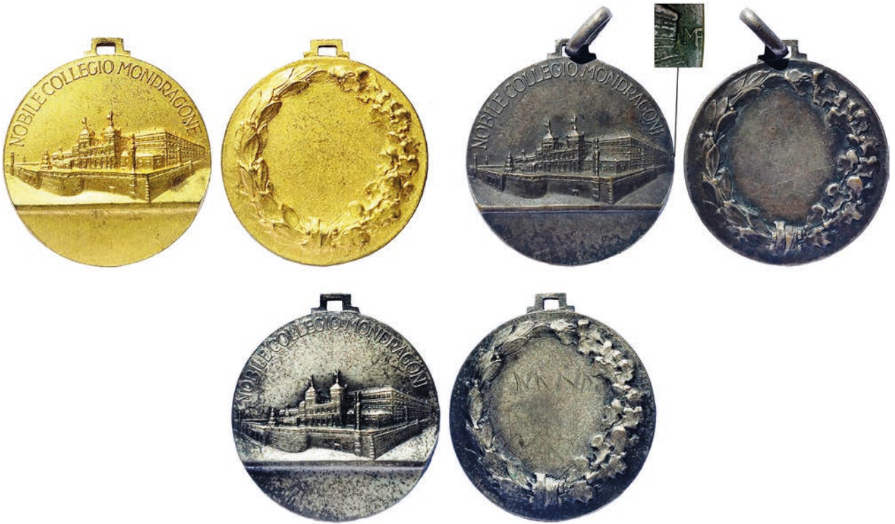
Fig. 10 – Medaglie premio del Nobile Collegio Mondragone di tipo 3. Su un esemplare è stato evidenziato il marchio di fabbrica Lorioli.