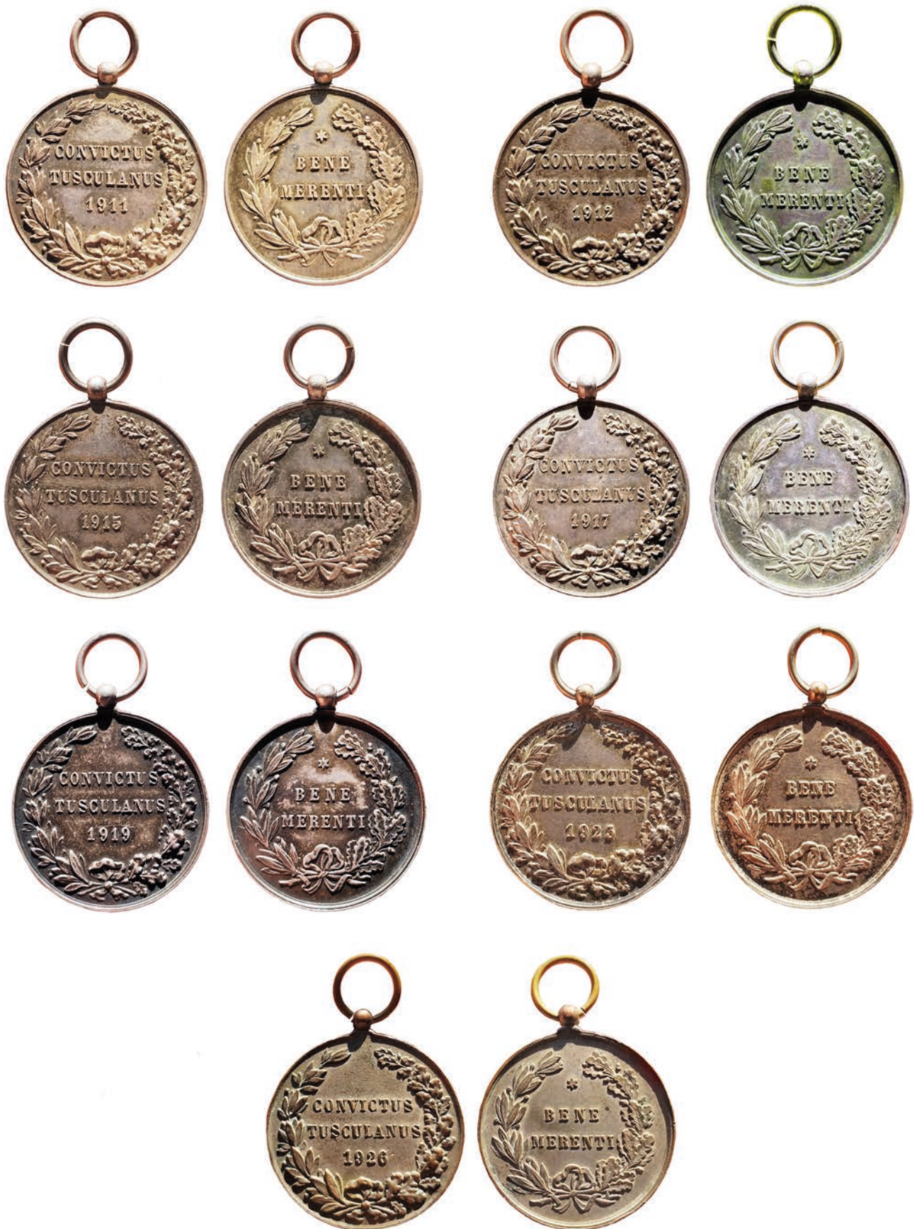
Fig. 8 – Medaglie premio del Nobile Collegio Mondragone di tipo 2b.