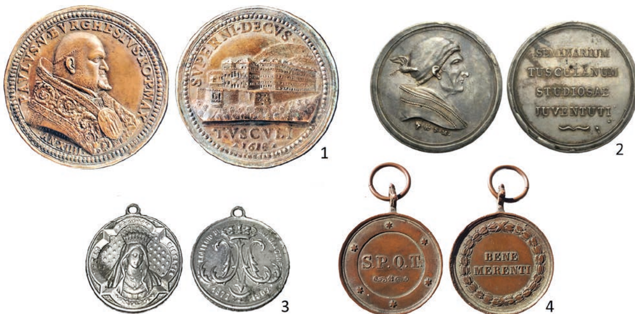
Fig. 3 – Medaglia di Paolo V con la rappresentazione di Villa Mondragone (1); medaglia premio settecentesca del Seminario Tuscolano (2); medaglia devozionale con la raffigurazione della Mater Pietatis commissionata dal Nobile Collegio Mondragone nel 1902 (3); medaglia di benemerenzia in bronzo con tracce di argentatura del Comune di Frascati (4).

di informazioni sulla vita collegiale 14 . La storia secolare di Villa Mondragone, attualmente in proprietà dell'Università di Roma Tor Vergata, si è intrecciata innumerevoli volte con personaggi, vicende e tematiche di grande importanza (si ricordano ad esempio le vicissitudini del famoso codice Voynich, o gli esperimenti scientifici di Galileo Galilei e Guglielmo Marconi che coinvolsero direttamente o indirettamente il complesso 15 ), e offre tuttora lo spunto per molteplici tipologie di approfondimenti, che spaziano dalla storia moderna e contemporanea, alla storia dell'arte, dell'architettura, ecc.. In particolare, in questa sede, si analizza per la prima volta il rapporto tra il collegio Mondragone e la medagliistica, evidenziando numerosi episodi storici che riguardarono l'utilizzo o la produzione di medaglie su commissione 16 . Verranno inoltre descritte e contestualizzate alcune serie di medaglie premio, individuate perlopiù in raccolte private e databili tra la seconda metà dell'Ottocento e la prima del Novecento 17 .