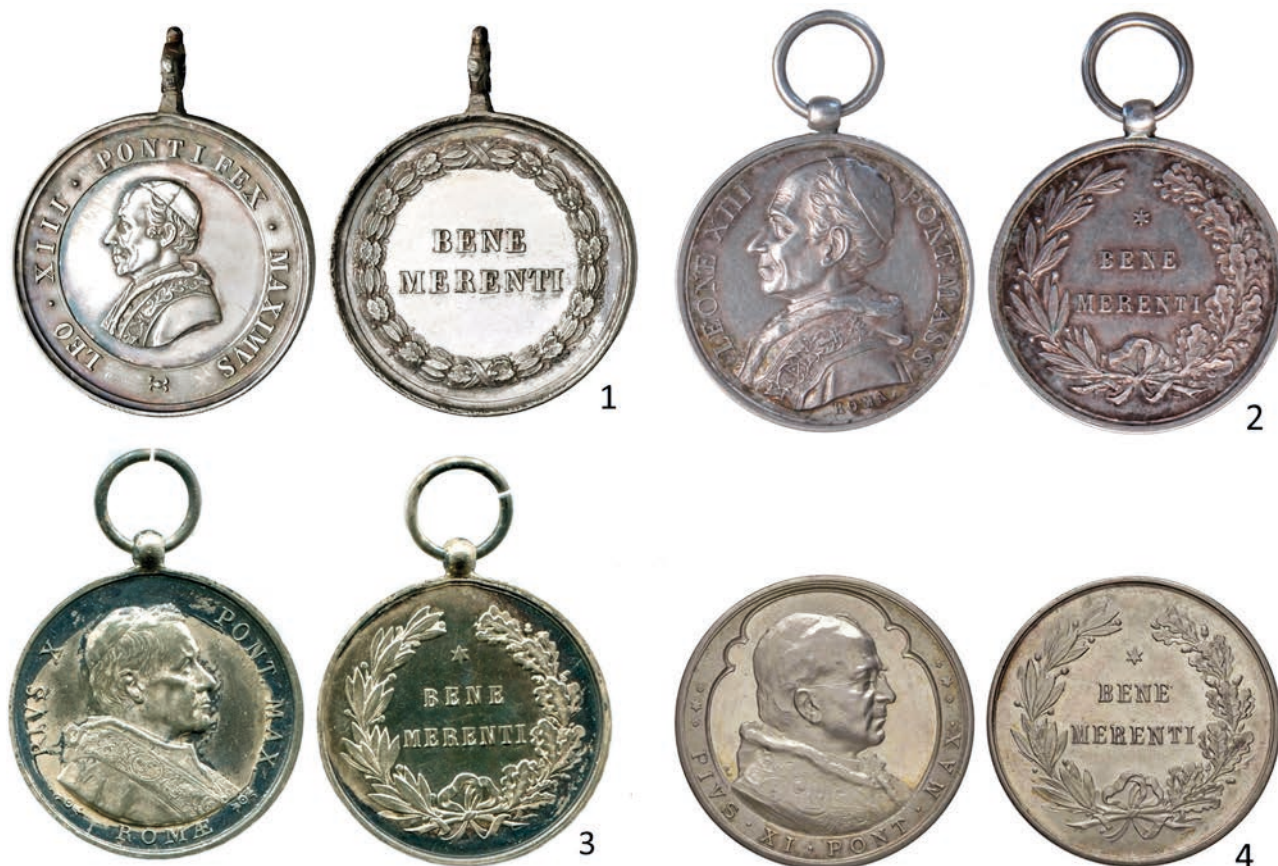
Fig. 6 – Medaglie papali di benemerenzza emesse da Leone XIII (1-2), Pio X (3) e Pio XI (4).

l'iscrizione 1889 al centro della corona, specificando chiaramente l'anno della premiazione. Il rovescio del tipo è caratterizzato da una corona di foglie di lauro e quercia con al centro l'epigrafe BENE / MERENTI. Le medaglie sono infatti assimilabili alla classe delle medaglie di benemerenzza, un'onorificenzza pontificia istituita da Pio VII nel 1817 come premio per le personalità che si erano distinte in ambito civile e militare. Questo tipo di medaglie fu realizzato in diversi modelli, moduli e metalli dai vari pontefici che si susseguirono tra il XIX e il XX sec., ed era generalmente caratterizzato dal ritratto del papa al dritto e dall'epigrafe "Benemerenti" al rovescio, spesso associata ad una corona vegetale. Inizialmente realizzate nella zecca pontificia, dopo l'unificazione furono prodotte nella zecca italiana o in varie officine private 58 .