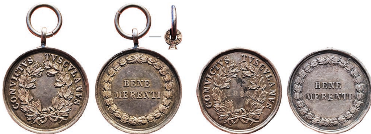
Fig. 5 – Medaglie premio del Nobile Collegio Mondragone di tipo 1.