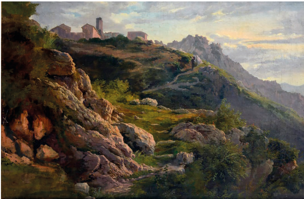
Fig. 2 – Cesare Mariani, Veduta di Olevano Romano , 1855, olio su tela, 39x56,5 cm, Roma, Museo di Roma, Inv. MR 20707

Gonfalone e San Rocco. Accanto a questi grandi cicli, la sua attività incluse anche esperienze di “pittura da cavalletto” che lo portarono a visitare e a ritrarre anche i noti scorci olevanesi (fig. 2).