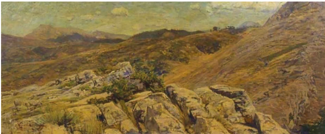
Fig. 3 – Onorato Carlandi, La Serpentara , 1903, olio su tela, AM 3167, Roma, Galleria d'Arte Moderna