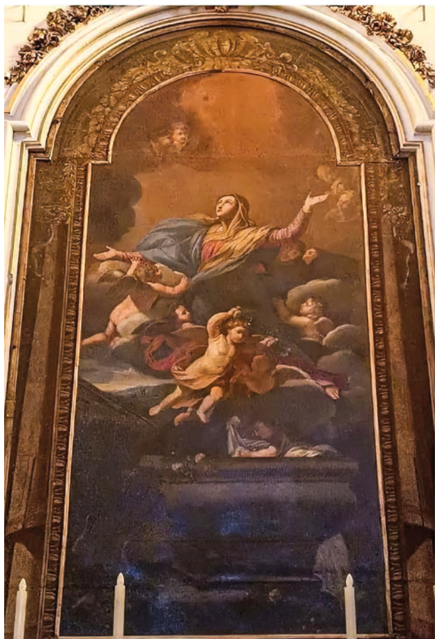
Fig. 2 – L'Assunta, chiesa di Santa Maria, Cave.

di colore, al di sotto il marrone risulta più freddo, mentre nella parte sovrastante si riesce a distinguere una linea di stacco tra l'originale e il seguente rifacimento.