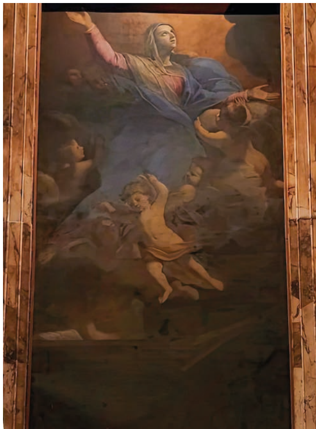
Fig. 4 – Andrea Camassei, Assunta, 1638, Roma, Pantheon.

dipinto, allo scopo di identificare le somiglianze e le differenze chiave di comparazione tra essi. Attraverso un'indagine approfondita di queste due opere si tenterà di conoscere la vera identità dell'opera di Cave.